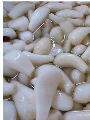
はなのきの黄金比で漬け込みます