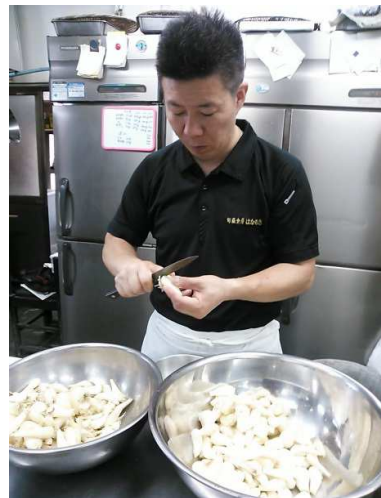
ひとつひとつ丁寧に...