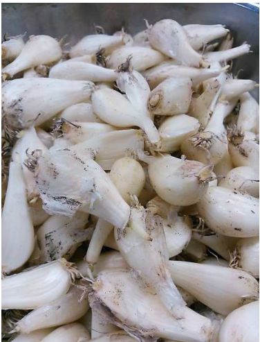
鳥取産のらっきょうです